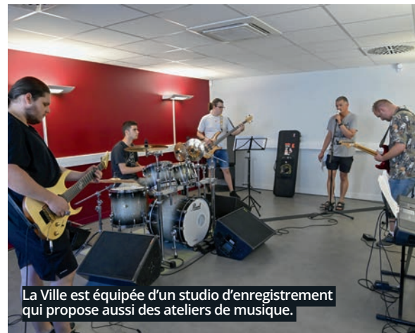
La Ville est équipée d'un studio d'enregistrement qui propose aussi des ateliers de musique.

sont situées en centre-ville participant ainsi à redynamiser le cœur de ville, créant des flux et des nouveaux usages. L'image de la ville s'en trouve bouleversée.