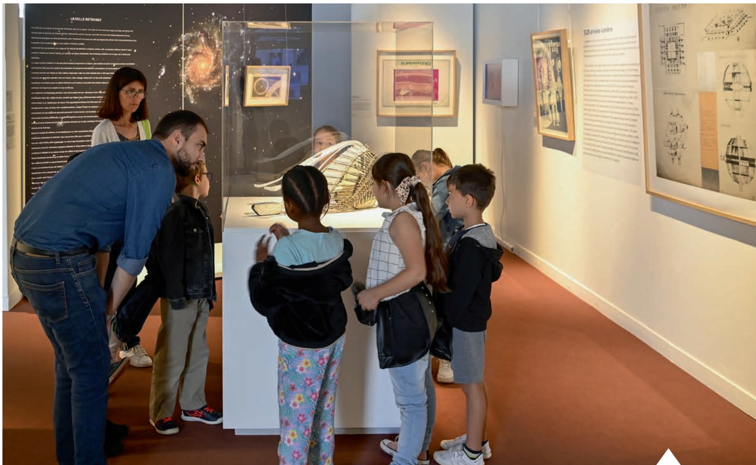
Plusieurs projets et visites ont été proposés aux scolaires dans le cadre de la Biennale d'art et d'architecture.