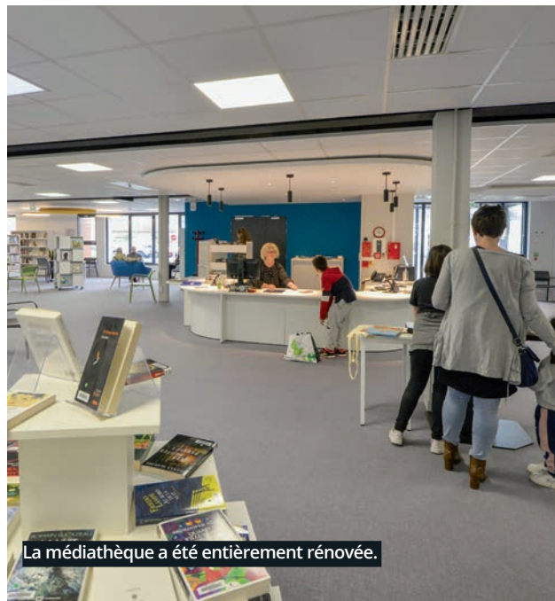
La médiathèque a été entièrement rénovée.

S amedi 2 juillet, plusieurs centaines de personnes se pressent vers le jardin de l'Abbaye. Des jeunes, des moins jeunes, des familles, des retraités... Ce soir-là, Thomas Fersen est en concert sur la scène des Estivales du Canal. Depuis 15 ans, la Ville de Vierzon propose, au cœur de l'été, un festival en plein air. Au fil des ans, l'événement n'a cessé de gagner en notoriété.