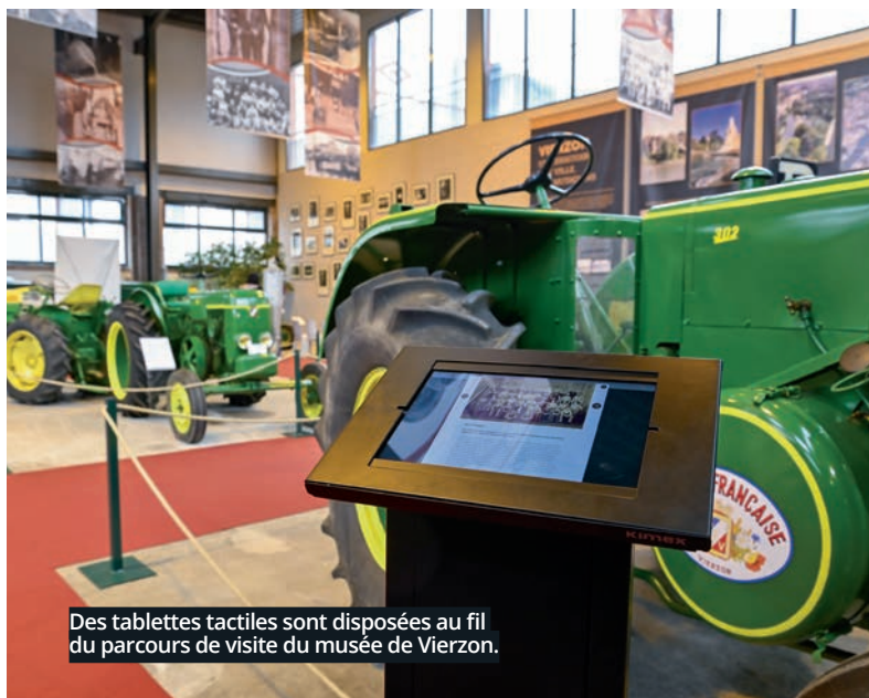
Des tablettes tactiles sont disposées au fil du parcours de visite du musée de Vierzon.

sur grand écran les œuvres des plus grands musées nationaux. Son ouverture à la veille du confinement n'a pas entaché sa fréquentation. Deux ans plus tard, ce ne sont pas moins de 17 000 personnes qui sont venues visiter les lieux. C'est aussi en cœur de ville, à Vierzon, que se tiendra la première Biennale d'art et d'architecture décentralisée du Fonds régional d'art contemporain Centre-Val de Loire. Une biennale féminine puisque seulement des femmes artistes et architectes ont été invitées à participer. Ce sera aussi une biennale d'espace public, les œuvres seront installées pour beaucoup en extérieur. Le B3, dans sa partie non rénovée sera investi avec un parcours de visite proposé à l'intérieur. Le B3, comme un trait d'union entre la ville d'hier et celle de demain. Le musée de Vierzon, ouvert en 2012 dans sa configuration actuelle et installé lui aussi au cœur de cet ancien site industriel, raconte cette histoire de notre ville avec un parcours de visite régulièrement renouvelé et modernisé.