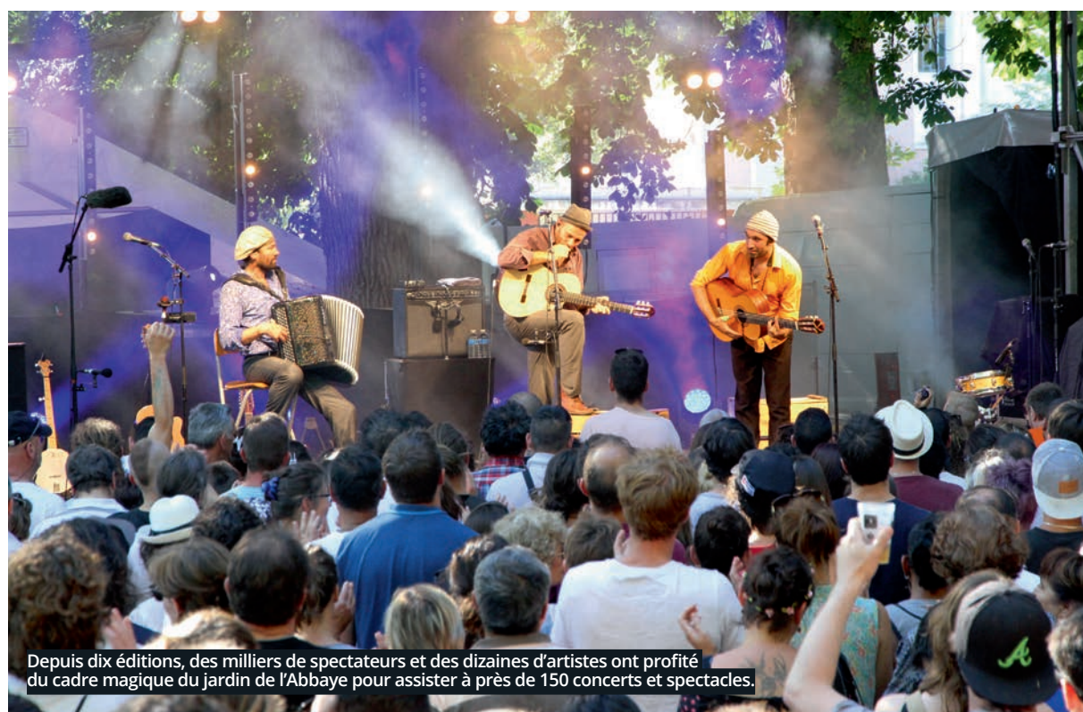
Depuis dix éditions, des milliers de spectateurs et des dizaines d'artistes ont profité du cadre magique du jardin de l'Abbaye pour assister à près de 150 concerts et spectacles.