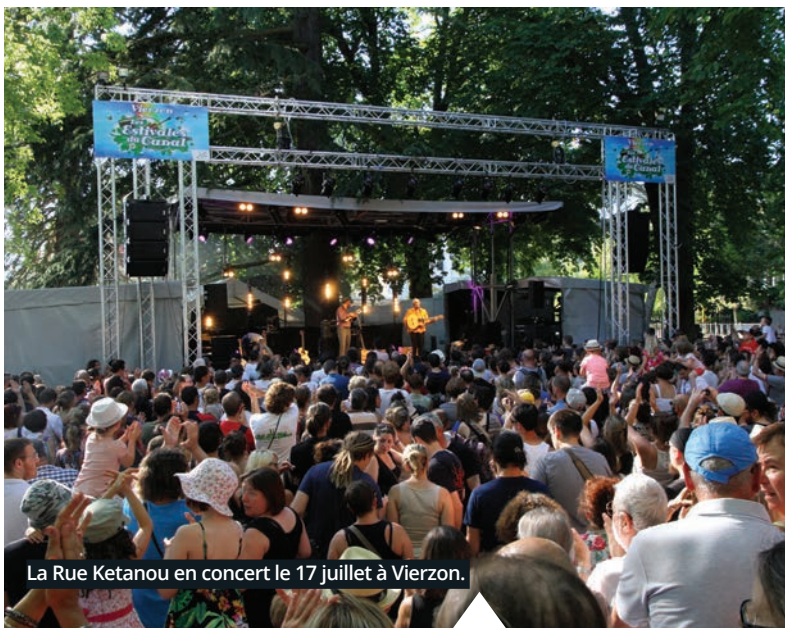
La Rue Ketanou en concert le 17 juillet à Vierzon.