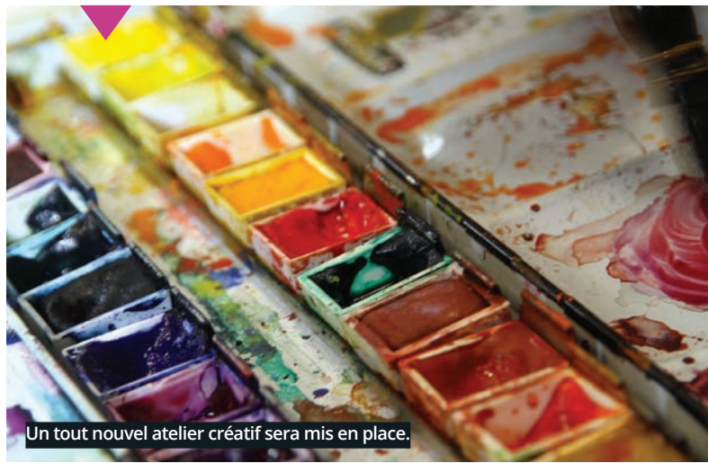
Un tout nouvel atelier créatif sera mis en place.

Le service animation du CCAS va faire peau neuve à la rentrée avec plusieurs objectifs : prévenir le vieillissement, faire découvrir le numérique aux seniors et développer les animations à domicile.