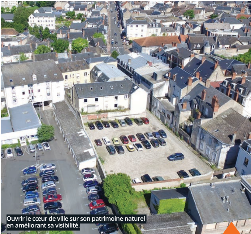
Ouvrir le cœur de ville sur son patrimoine naturel en améliorant sa visibilité.

Le troisième enjeu consiste à savoir si oui ou non il faudra reconstruire pour fermer l'arrière des bâtiments après les démolitions. Quelle pourrait être la fonction de ces nouveaux bâtiments : du commerce, des services, du logement ?