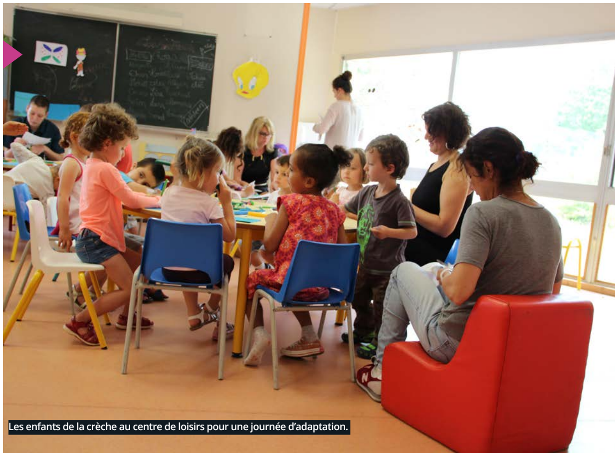
Les enfants de la crèche au centre de loisirs pour une journée d'adaptation.