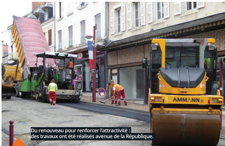
Du renouveau pour renforcer l'attractivité : des travaux ont été réalisés avenue de la République.

C omme beaucoup de villes moyennes, le centre-ville de Vierzon a souffert ces dernières années de plusieurs mutations.