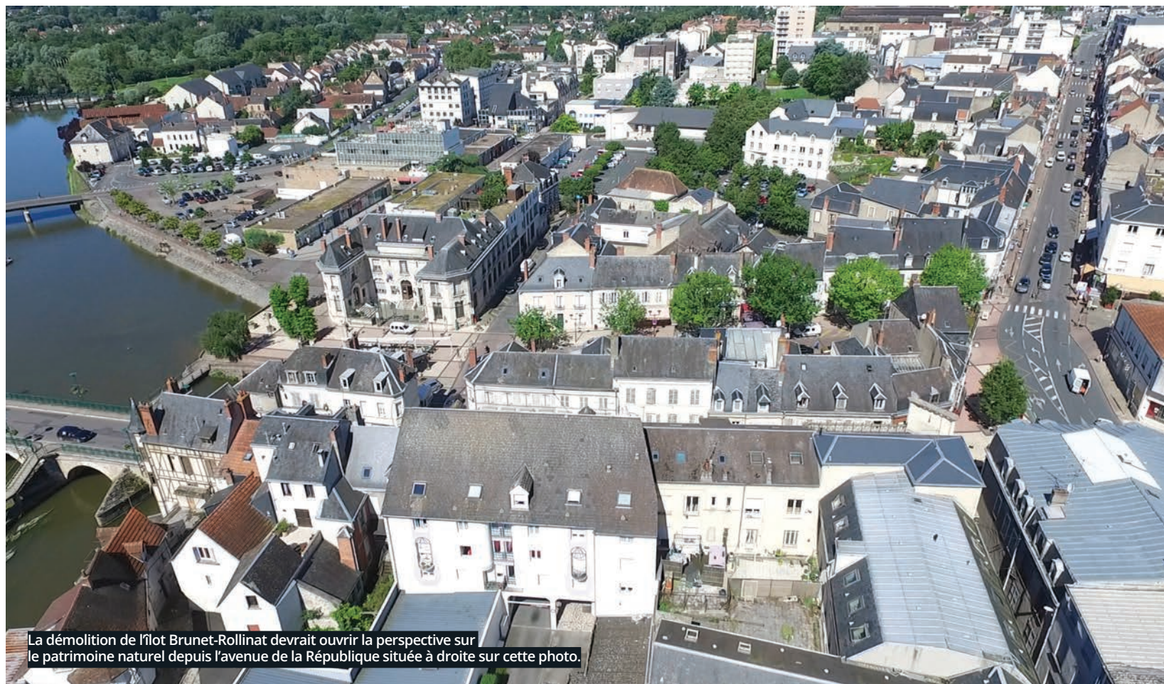
La démolition de l'îlot Brunet-Rollinat devrait ouvrir la perspective sur le patrimoine naturel depuis l'avenue de la République située à droite sur cette photo.