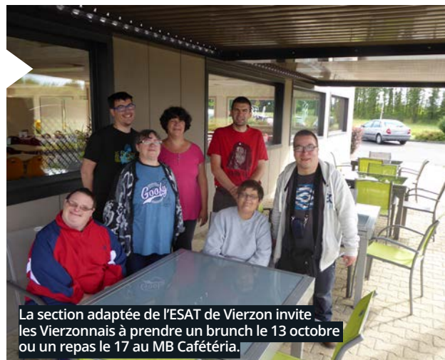
La section adaptée de l'ESAT de Vierzon invite les Vierzonnais à prendre un brunch le 13 octobre ou un repas le 17 au MB Cafétéria.