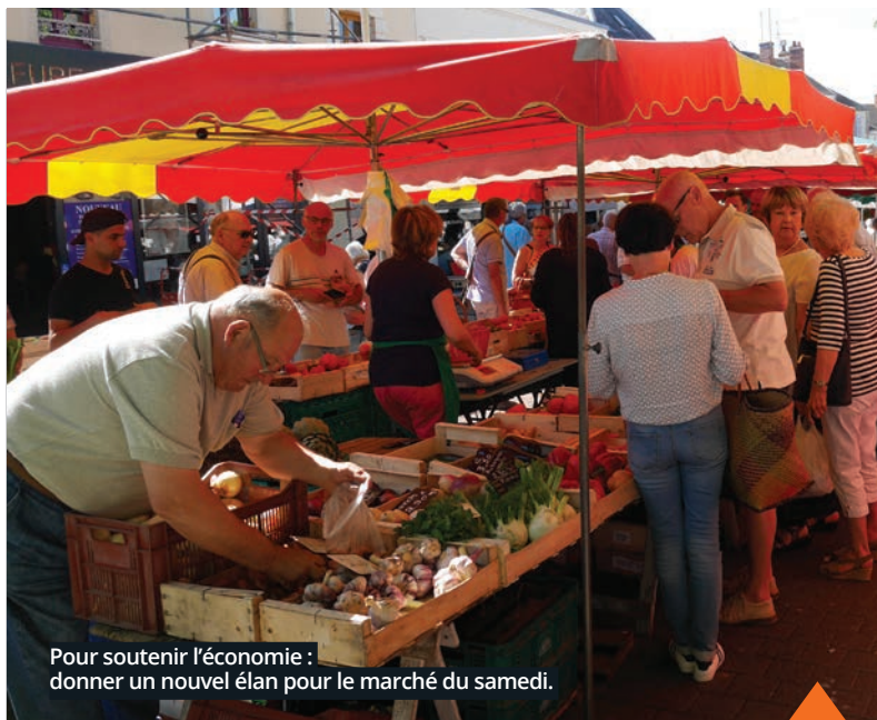
Pour soutenir l'économie : donner un nouvel élan pour le marché du samedi.